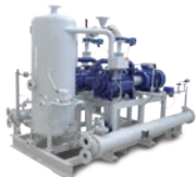
GRUPPI VUOTO VACUUM SYSTEMS