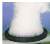
RETI DIFFUSIONE ARIA AERATION DIFFUSER SYSTEMS