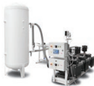
SISTEMI INGEGNERIZZATI ENGINEERING SYSTEMS