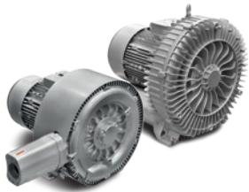
COMPRESSORI - ASPIRATORI A CANALE LATERALE SIDE CHANNEL BLOWERS