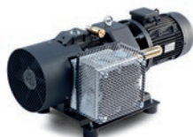
POMPE PER VUOTO A PALETTE LUBRIFICATE E A SECCO OIL AND DRY ROTARY VANE PUMPS