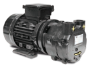
POMPE PER VUOTO AD ANELLO LIQUIDO LIQUID RING VACUUM PUMPS