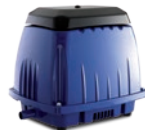
COMPRESSORI LINEARI A MEMBRANA LINEAR MEMBRANE BLOWERS